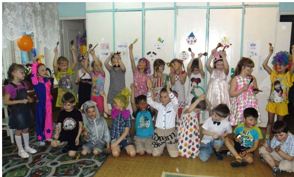
Д. Кабалевский «Клоуны», исполняет подг. гр. №9