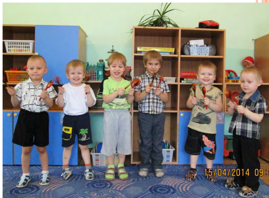
Ансамбль ложкарей, р.н.п. «Калинка», исп. млад. гр №10