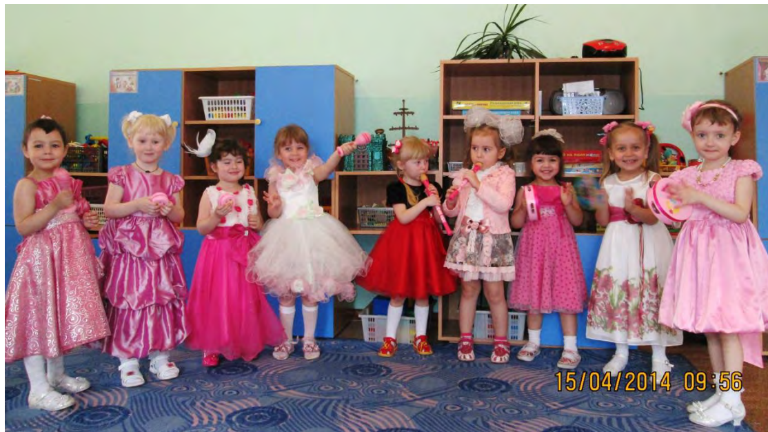
Р.н.п. «Как у наших, у ворот», исп. млад. гр.№10