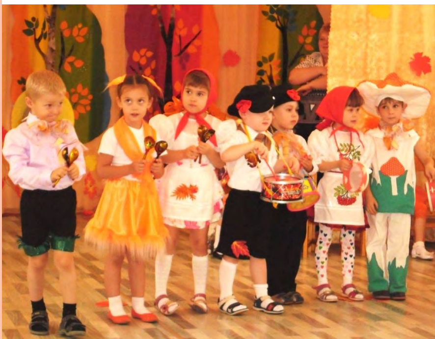
Р.н.п. «Ах, ты берёза», исп. средняя гр. №7